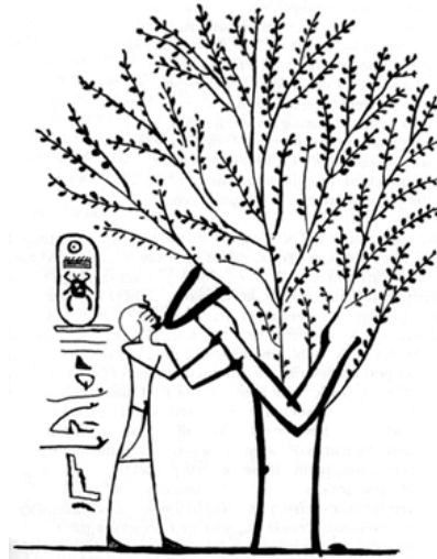
Fig.3 : Le roi Thoutmosis III allaité par Isis sous la forme d'un arbre sacré.

G.Posener, S.Sauneron et J.Yoyotte, Dictionnaire de la civilisation égyptienne , Paris, 1988, p. 140.