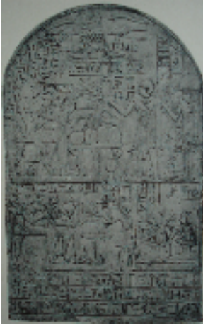
Fig.8 : Stèle d'Abydos. P.Lacau, Stèles du Nouvel Empire , pl. LIII.