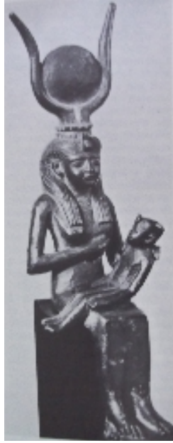
Fig.2 : La déesse Isis allaité Horus.

G.Posener, S.Sauneron et J.Yoyotte, Dictionnaire de la civilisation égyptienne , Paris, 1988, p. 140.