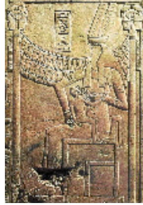
Fig.6 : La déesse Rénénoutet. W.Wreszinski, Atlas , pl. 198.