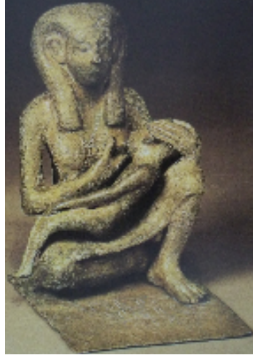
Fig.1 : Femme nourricière de la Moyenne Empire, cuivre, Musée de Berlin (14078).

R.Schulz, M.Seidel, Egypt the world of the Pharaohs , China, 2007, p. 409.