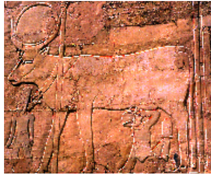
Fig.5: Thoutmosis III entrain d'allaiter de la déesse vache Hathor, dans la chapelle de Thoutmosis III à Deir el-Bahari.

M.Werbouck, Le temple d'Hatshepsout à Deir el Bahri , Brussel, 1948.