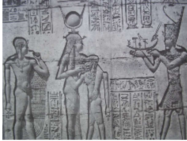
Fig.4 : La déesse Hathor entrain d'allaiter le roi, dans le mammisi du temple d'Hathor à Dendérah.

B.Watterson, Gods of Ancient Egypt , Hong Kong, 1996, p. 116-117.