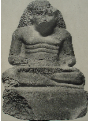
Fig.7 : statue de Menkheperresonb G.Legrain, CGC. Statues et statuettes de rois et de particuliers , t.I, Le Caire 1906, pl. 74.